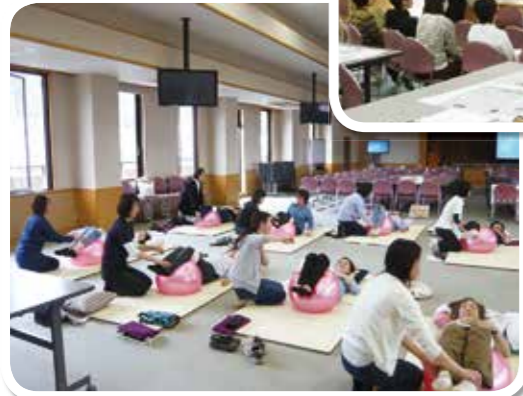
廃用症候群予防の ための実技演習