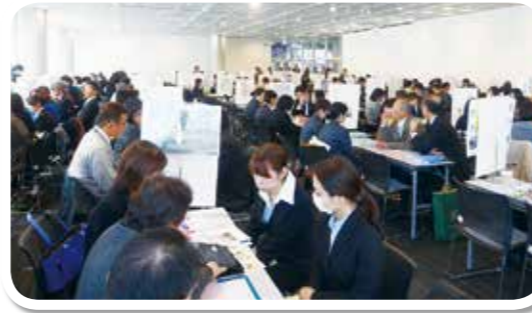
看護職員就職ガイダンス

平成4年「看護師等の 人材確保の促進に関する 法律」が制定され、平成 5年、山梨県より「山梨 県ナースセンター」の指 定を受け看護協会では、 看護職員の確保・定着に 寄与する事業を展開して います。