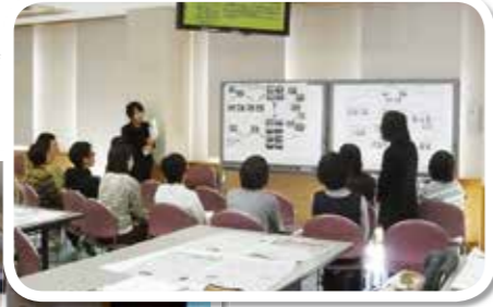
看護実践 成果報告会

看護協会では、看護の質の向上を図るため、時代の趨勢や現場のニーズを反映した教育研修や学会を企画・運営するなど、新人からベテランまで、多くの看護職に学習・研究の場を提供しています。