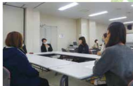
座談会では活発な情報交換ができました