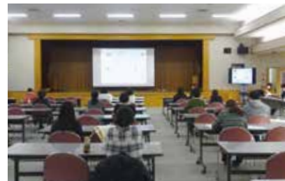
みなさん、講師の話をもっと真剣に聞いていました