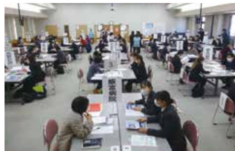
各ブースで求職者は熱心に質問し、質問に対して、求人施設担当者は丁寧に答えていました

日時●令和5年12月6日(水) 13:30~15:30 会場●公益社団法人山梨県看護協会 看護教育研修センター 内容●施設ごとにブースを設け、求職者等が複数のブースを訪問し、各施設の担当者から直接仕事の内容や採用に関する情報を聞くことができる。 相談コーナーでは、専門の相談員が就職に関する相談を受付ける。