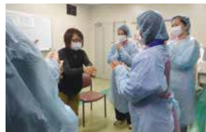
現職の頃を思い出しながら、楽しく演習していました